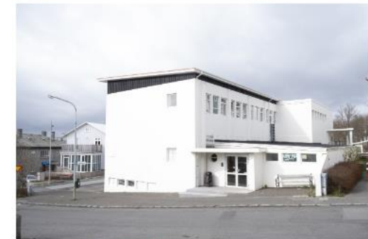
Uppsalar (U) Matsalurinn