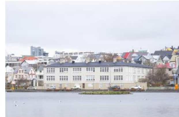
Miðbæjarskóli (M) Skólastofan okkar